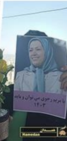
وآخرون في همدان، وتبريز، وشيراز، وآراك وجابهار يحملن لافتات في أيديهن كُتب عليها "لا للحجاب بالإكراه، لا لحكومة بالإكراه" و"مع مریم رجوی مُمكنٌ وواجب".