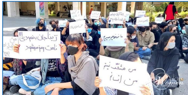
اعتراض دانشجویان در دانشگاه تهران

مهسا (ژینا) امینی ۲۲ ساله اهل سقز کردستان ایران برای دیدار با بستگانش در پایتخت به تهران سفر کرده بود. او روز ۲۲ شهریور با خشونت دستگیر شد. به گفته شاهدان عینی ماموران حکومتی او را در خودروی ون نیروی امنیتی و بازداشتگاه گشت ارشاد در خیابان وزرا مورد ضرب و شتم قرار دادند. تنها دو ساعت پس از دستگیری، او به کما رفت. به گفته پزشکان او دچار سکت قلبی و خونریزی مغزی شده بود. ضربات سنگینی که به سرش وارد شده بود منجر به شکستگی جمجمه شد و او سرانجام در روز ۲۵ شهریور ۱۴۰۱ جان خود را از دست داد. قتل وحشیانه مهسا امینی به دست گشت ارشاد خشم عموم مردم را در ایران و سراسر جهان برانگیخت. رئیس جمهور برگزیده شورای ملی مقاومت ایران، مریم رجوی، برای مهسا امینی اعلام عزای عمومی کرد و تأکید نمود که گشت ارشاد باید منحل شود. وی زنان غیرتمند ایران را به اعتراضات سراسری علیه رژیم پلید و زن ستیز آخوندی فراخواند. خانم رجوی تأکید کرد «ستم آخوندها و پاسداران جهل و جنایت، با ایستادگی و مقاومت زن ایرانی درهم خواهد شکست. با تمام قوا باید با این رژیم و گشت‌های سرکوبگر آن مقابله کرد».