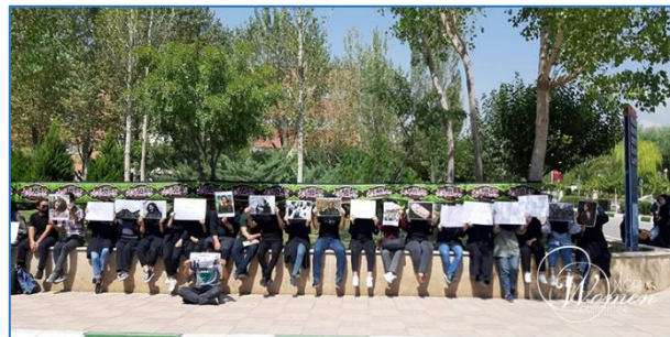
دانشجویان دانشگاه علامه تهران