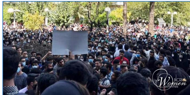
دانشجویان دانشگاه امیرکبیر