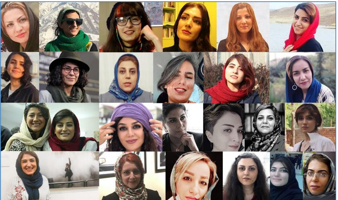
برخی از زنان دستگیر شده در جریان اعتراضات اخیر

نیروهای امنیتی و اطلاعات همچنین بازداشت های گسترده ای در میان فعالان حقوق بشر و حقوق مدنی، زندانیان سیاسی سابق، روزنامه نگاران و حتی فیلمسازان انجام داده اند.