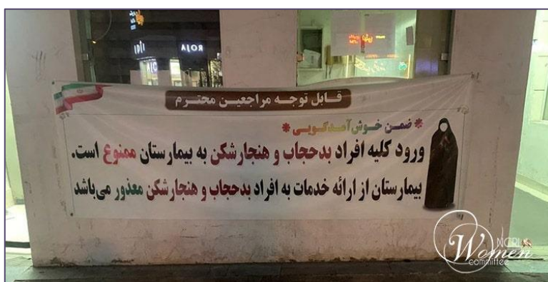
این بیمارستان ورود زنان بی‌حجاب را ممنوع کرده است

نیروی انتظامی بسیاری از محل‌های کسب و کار را تعطیل کرد و مدیران آنها را به دلیل ارائه خدمات به زنان بی‌حجاب دستگیر کرد. دادستان عمومی و انقلاب شهرستان دماوند کارکنان یک بانک را به دلیل پاسخگویی به یک زن بی‌حجاب بازداشت کرد. با کارمندان زن شرکت‌های بزرگ از جمله دیجی‌کالا و طاقچه به دلیل حضور بدون حجاب اجباری در محل کار برخورد قانونی صورت گرفت. این کسب‌وکارها با تعلیق موقت مواجه شدند، اما پس از واکنش عمومی، فعالیت خود را از سر گرفتند.