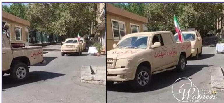
خودروهای استتار شده در پردیس دانشگاه تهران گشت می دهند

رژیم ملایان نگران از اینکه کافه های اطراف دانشگاه به عنوان مراکزی برای فعالیت علیه امنیت ملی به کار گرفته شوند، دستور بسته شدن آنها را صادر کرد. این اقدامات نشان دهنده نگرانی رژیم از اعتراضات احتمالی است.