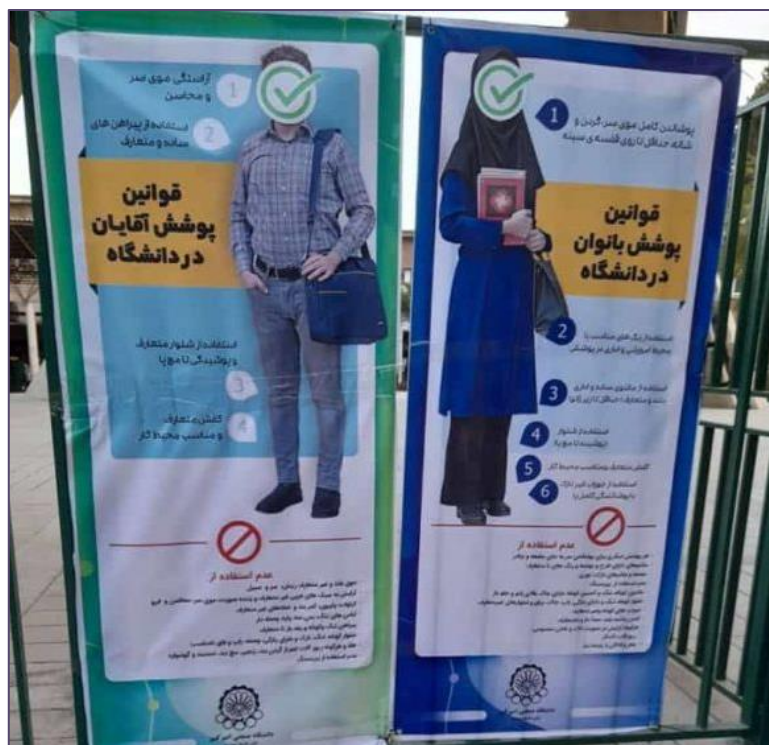
بنر مقررات پوشش در دانشگاه امیرکبیر تهران

رژیم ملایان نگران از اینکه کافه های اطراف دانشگاه به عنوان مراکزی برای فعالیت علیه امنیت ملی به کار گرفته شوند، دستور بسته شدن آنها را صادر کرد. این اقدامات نشان دهنده نگرانی رژیم از اعتراضات احتمالی است.