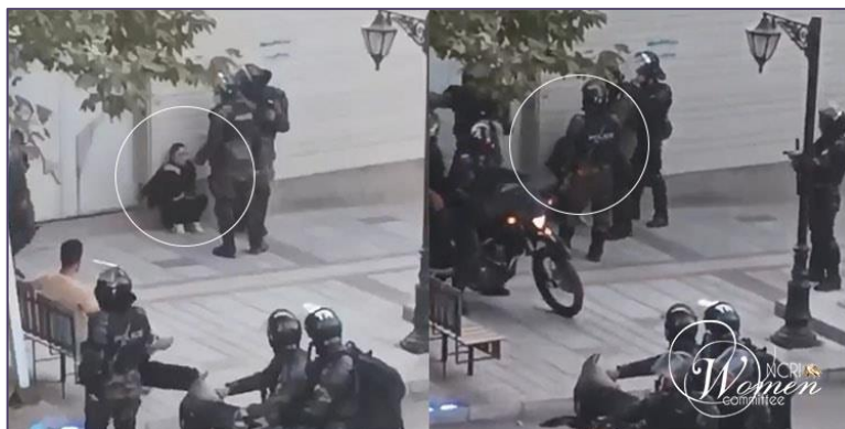
زن جوان تنها در همدان در محاصره نیروهای امنیتی

بر جمهوری اعدامی» آغاز شد. نیروهای امنیتی در صحنه ای تکان دهنده یک زن تنها را برای دستگیری در منطقه ۱۳ همدان محاصره کردند.