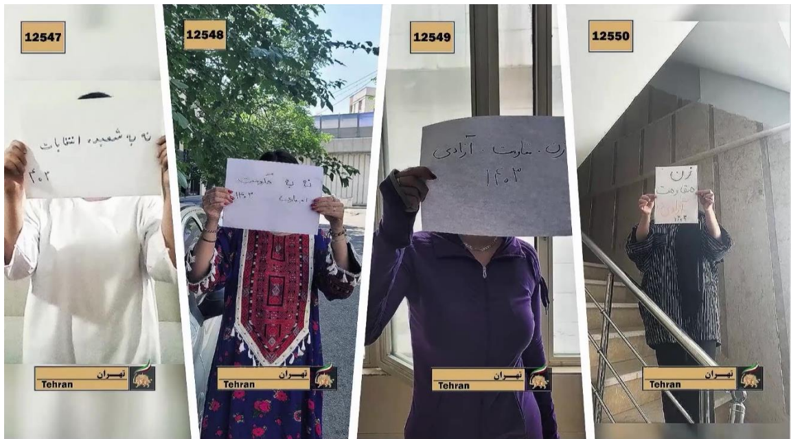
زنان در تهران برگه هایی در دست دارند که روی آنها نوشته شده: «زن، مقاومت، آزادی»، «نه به حکومت اجباری» و «نه به شعبده انتخابات».