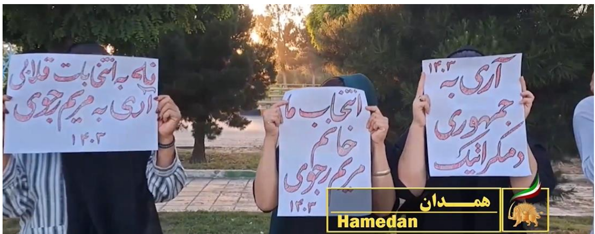
سه خانم در همدان با در دست داشتن پلاکاردهایی که روی آن نوشته شده بود: «آری به جمهوری دموکراتیک، انتخاب ما مریم رجوی، و نه به انتخابات قلابی، آری به مریم رجوی.»