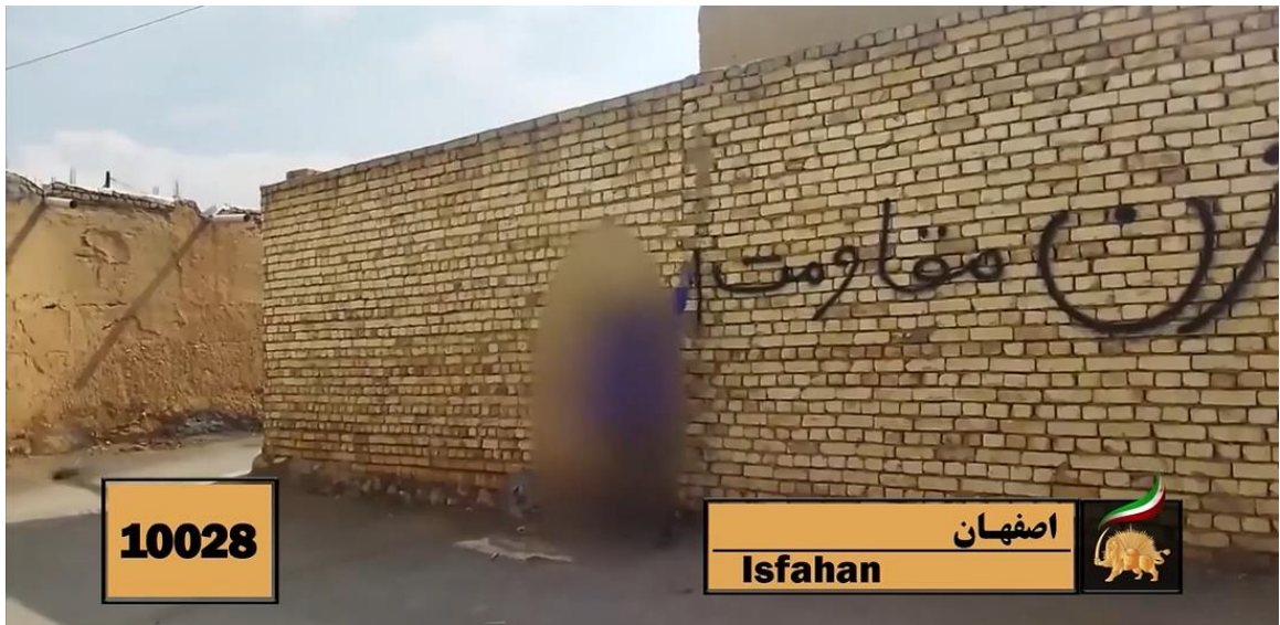
یک عضو کانون شورشی در اصفهان روی دیوار می نویسد: «زن، مقاومت، آزادی»