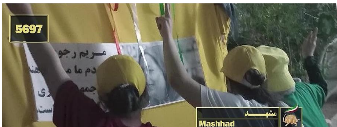
دختران نوجوان در مشهد بنرهایی با جمله مریم رجوی در دست دارند که «آنچه مردم ما می خواهند یک جمهوری دموکراتیک است.»