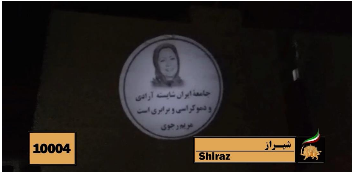
هواداران مقاومت ایران بخشی از سخنان خانم مریم رجوی را بر روی دیوار یک ساختمان در شیراز تصویرنگاری کرده اند: «جامعه ایرانی شایسته دموکراسی و برابری است.»